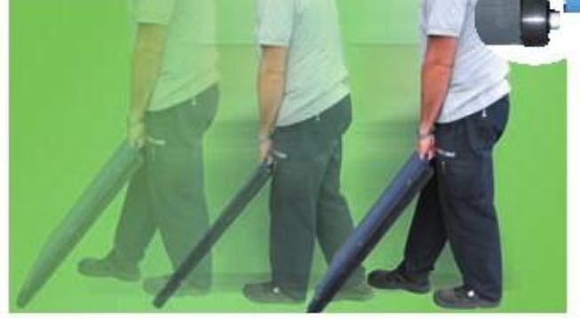
WWSD / WWSE

WWS platformlar a özel dinamik tartım yapabilme kapasitesinde yönelik özel 3590KR indikatör kullanılmakta otomatik her aks ı toplama ve çıktı alma özelliğı bulunmakta.